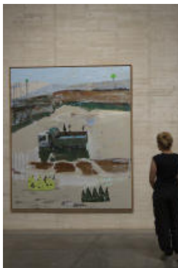
Exposición La Nave de los Locos , del artista Juan Ugalde. MUSAC