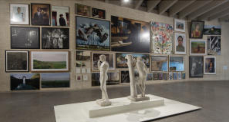
Exposición Exotermia. Semiótica de la ubicación en la Colección MUSAC